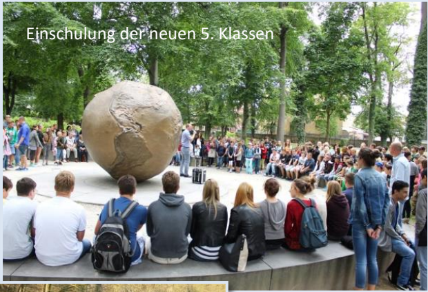
Einschulung der neuen 5. Klassen