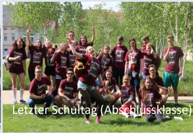
Letzter Schultag (Abschlussklasse)