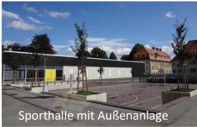
Sporthalle mit Außenanlage

Die Adam-Olearius-Schule in Aschersleben ist eine staatlich anerkannte Gemeinschaftsschule in freier Trägerschaft. Unsere Unterrichtsräume, der Pausenhof sowie die Sporthalle befinden sich auf dem Campus Bestehornpark.