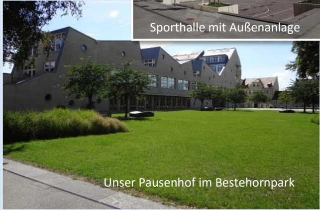
Unser Pausenhof im Bestehornpark