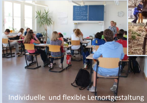
Individuelle und flexible Lernortgestaltung