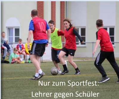
Nur zum Sportfest: Lehrer gegen Schüler