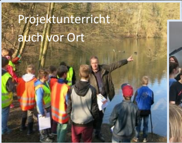
Projektunterricht auch vor Ort